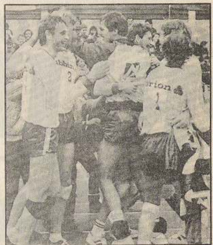
● Vreugdedans na de 3-0 zege van Orion.