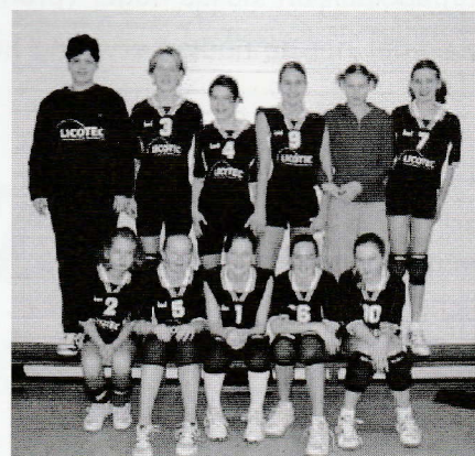
Ook meisjes C1 dragen Licotec-shirts

derneming beschikt over de ervaring, de kennis en de faciliteiten om zowel architectonisch gecompliceerde als relatief eenvoudige projecten uit te voeren.