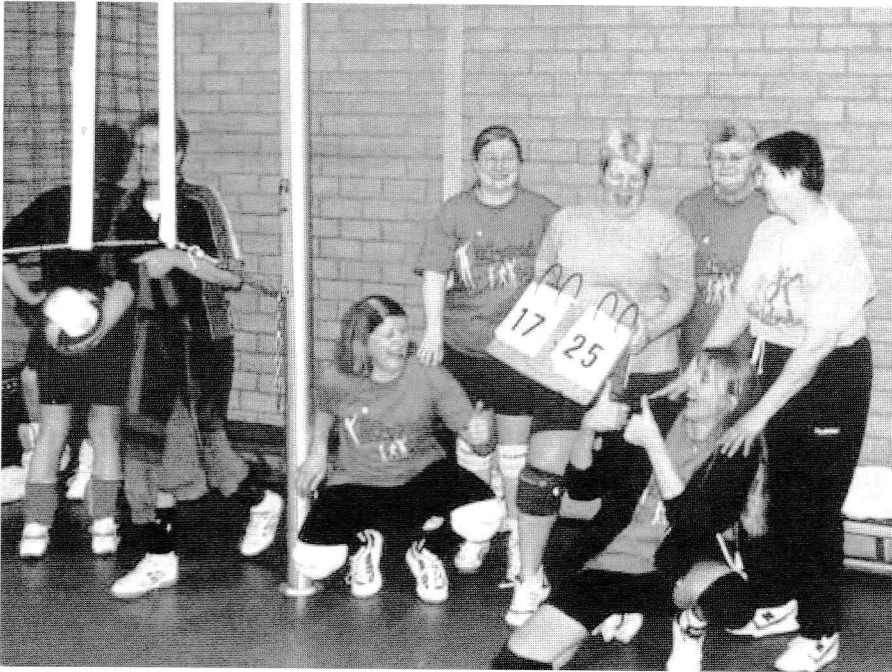
"We hebben een set gewonnen!"

Dames 1/2 van de dinsdagavond probeert zich staande houden bij de diverse recreantentoernooien. En dat valt niet echt mee.