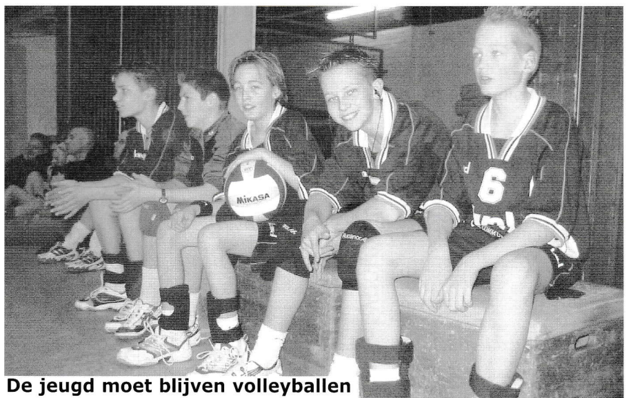
De jeugd moet blijven volleyballen

We zijn er nog niet, maar we zijn op de goede weg