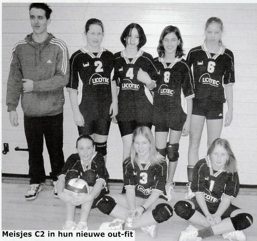
Meisjes C2 in hun nieuwe out-fit

Ook het compleet leveren, installeren en aansluiten van rook- en warmteafvoerinstallaties behoort tot de mogelijkheden. Hierbij speelt de omvang van de projecten geen enkele rol, want Licotec levert altijd vakmanschap op niveau. Een fraai voorbeeld in Doetinchem is de fraaie overkapping van het Atrium 2000 aan de Kennedylaan. Licotec is gevestigd in Duiven en wil je het bedrijf opzoeken op internet, surf dan naar : www.licotec.nl