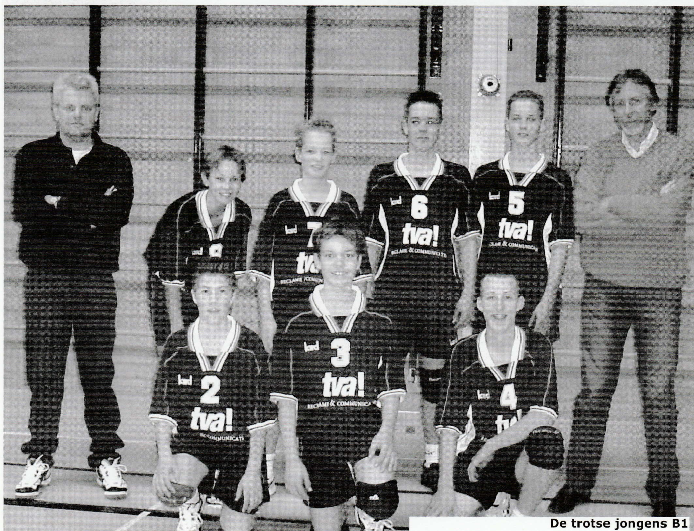
De trotse jongens B1

Het bedrijf geeft elke dag concreet inhoud aan, wat het noemt 'geïntegreerde communicatie'