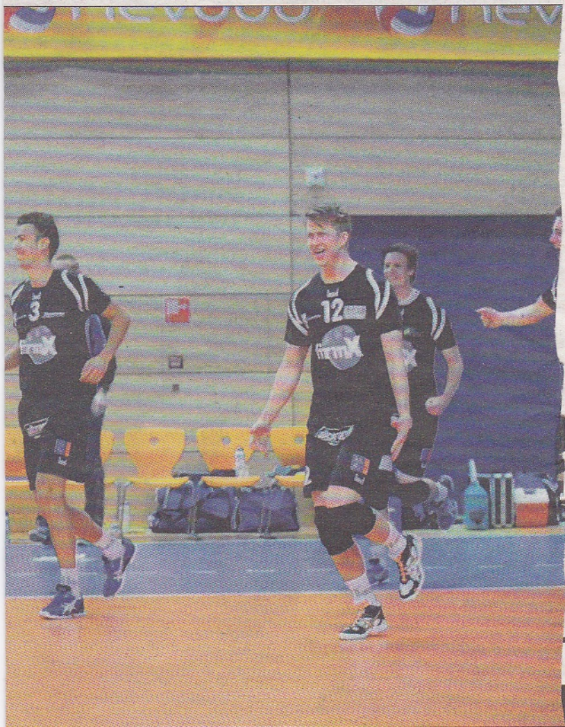
erfinale tegen Dynamo.

Oranje. Bondscoach Edwin Benne maakte vorige week de voorselectie bekend. Van de achttien geselecteerde spelers komen er slechts drie uit in de Nederlandse eredivisie en Van Haarlem is een van hen. „Ik ben er ontzettend blij mee”, liet de Achterhoeker weten na afloop van de gewonnen bekerfinale. „Hij was in onze wedstrijd tegen Zwolle al komen kijken. Ik hoop dat ik ook de definitieve selectie haal. Het is een geweldige kans en goed voor je ontwikkeling.”