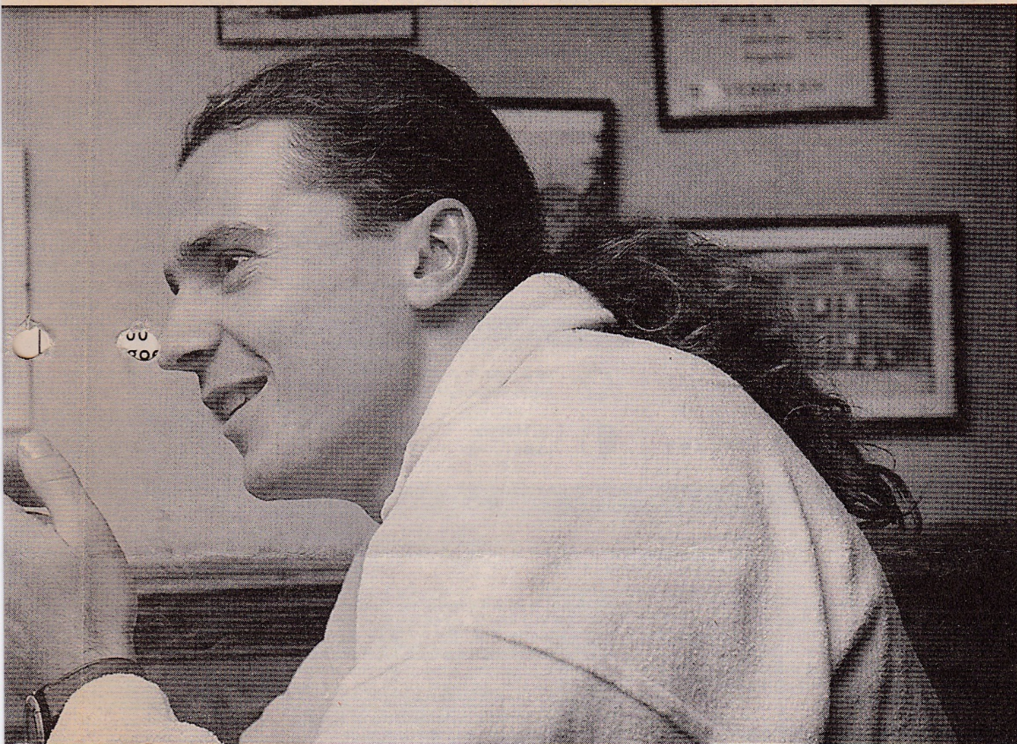
Ulers van het Centrale Tsjechische team die in het buitenland spelen."

tiel team. Nee, het spel loopt nog niet zo goed. We hebben een talentvol team, maar de spelers zijn nog jong. En spelers die nog niet ervaren zijn, maken fouten. Of het team moeilijk is te sturen? Het team is nieuw en af en toe is dat wel eens moeilijk. Zeker als de jonge jongens spelen. Maar dat zal ongetwijfeld nog beter worden. Dat is een kwestie van veel oefenen en veel toernooien spelen."