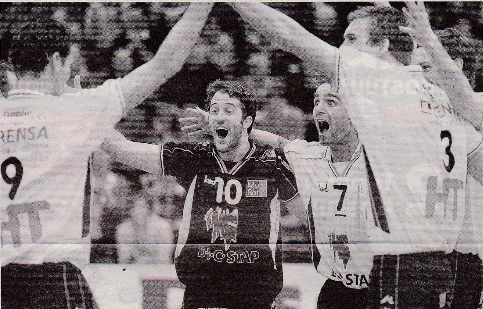
Orion juicht in de heenwedstrijd tegen het Bosnische Kakanj die met 3-0 werd gewonnen. Gisteren plaatsten de Doetinchemmers zich na de uitwedstrijd die met 3-2 verloren ging. Orion had slechts één set nodig om verder te bekeren.