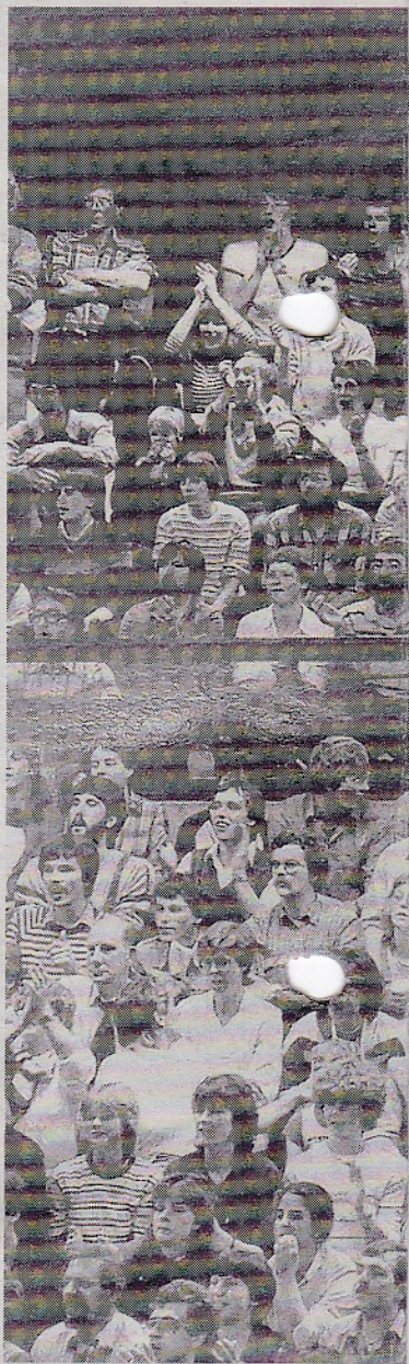
Uitpuilende tribunes in Doetinchem

Er zijn parallellen te trekken met de titelstrijd Orion-Nesselande anno 2009 en Orion-Voorburg van toen. Broens: „Nesselande levert nu de meeste internationals van de Nederlandse clubs. Voorburg was toen ook hofleverancier van Oranje. Orion was geen favoriet tegen Voorburg. We konden alleen