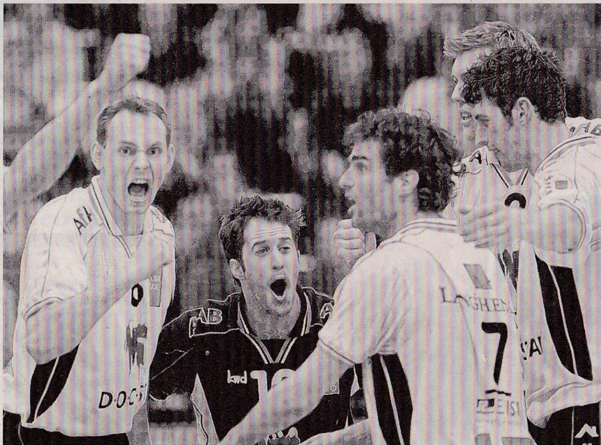
Juichende spelers van Orion, een veel voorkomend verschijnsel dit seizoen.