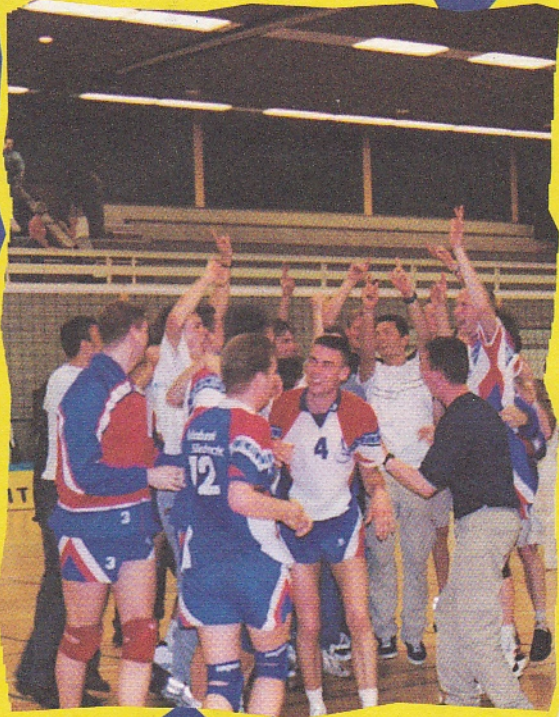
Sliedrecht Sport in jubelstemming.