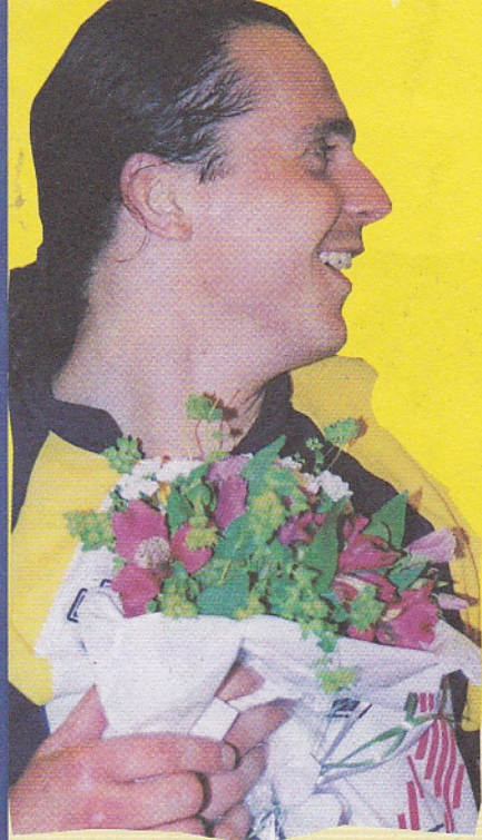
Frenkie goes to Brasil...