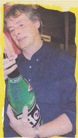
Alleen de gedachte al...