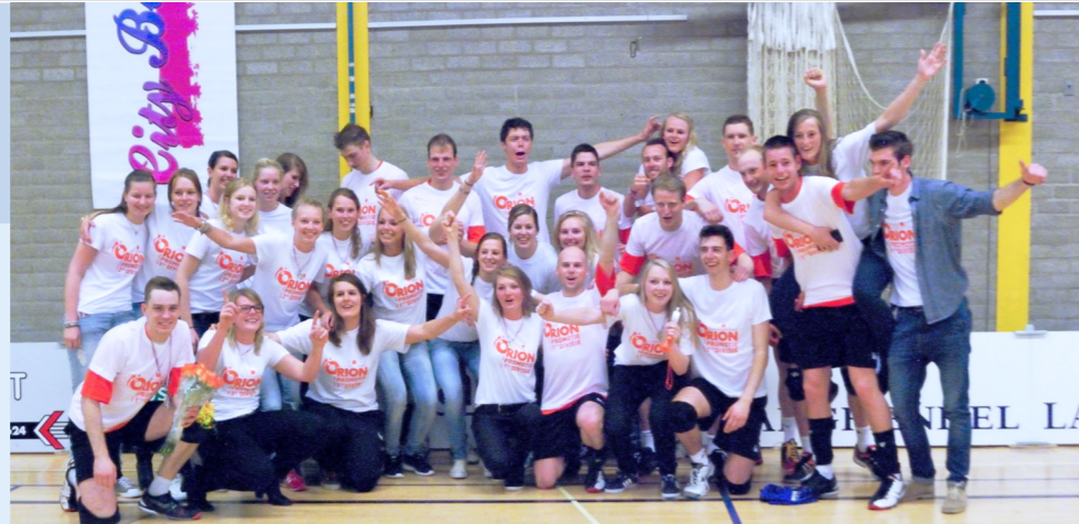
Even een stap terug in de tijd. Naar seizoen 2013/2014. De laatste wedstrijd op zaterdag 10 mei in sporthal Rozengarde bracht Orion maar liefst drie kampioenen. Dames 1 promoveerde naar de Eerste Divisie, Dames 2 naar de Tweede Divisie en Heren 2 naar de Eerste Divisie.

Dames 1 ging na één seizoen nog een treetje hoger, omdat VVC (Vught) failliet ging en Orion de opvallende plaats in de Topdivisie mocht innemen. Negen jaar later is er van de euforie van toen weinig meer over. Zowel Dames 1 als Dames 2 zijn afgelopen seizoenen gedegradeerd. Dames 1 naar de Eerste Divisie en Dames 2, na nog wat stapjes terug, zelfs naar de Eerste Klasse. Heren 2 is de uitzondering die de Orionvlag hoog houdt. De heren spelen na negen jaar niet meer Eerste Divisie, maar tekenen voor het vierde seizoen Topdivisie. Kortom, vooral in de dameslijn is het uithuilen en opnieuw beginnen.