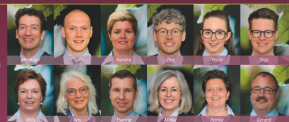
Onze betrokken medewerkers: