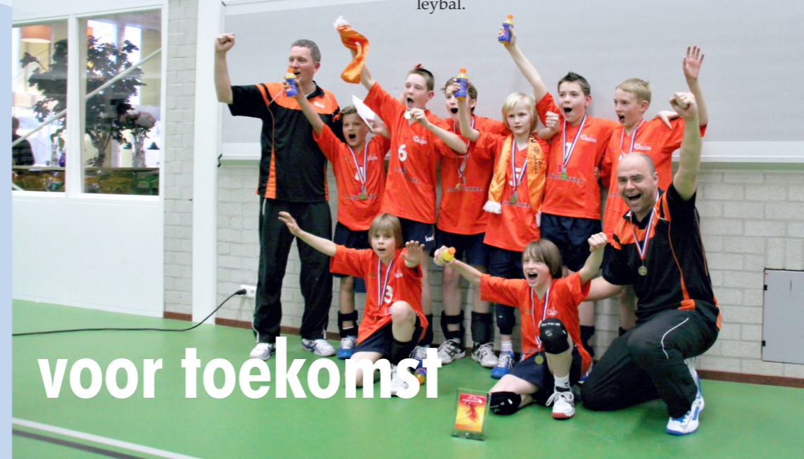
Jongens D kampioen van Nederland 2014. Herken je ze nog?

Ondertussen blijft Rensa Family Orion een actieve club met een breed aanbod op top- en breedtesport, jeugd en recreatief volleybal.