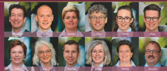
Onze betrokken medewerkers: