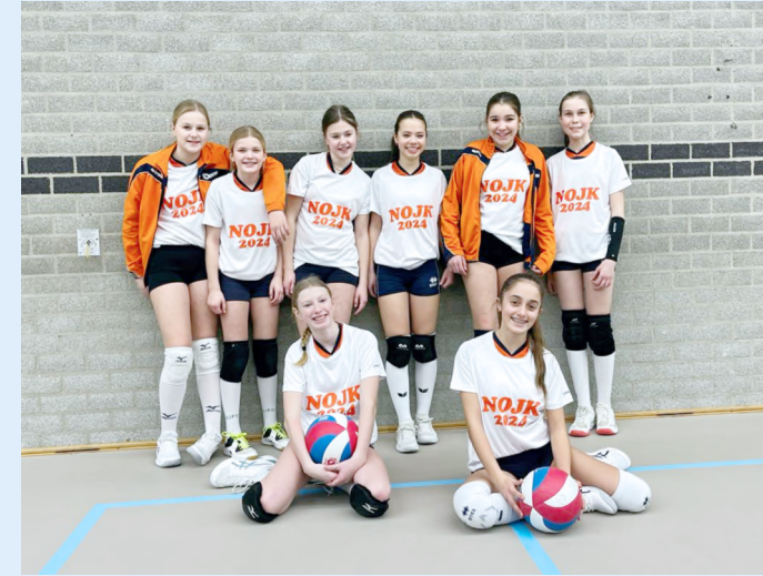
Foto op pag. 20: Meisjes B ongeslagen naar finale. Foto links: Meisjes C na kranig verweer uitgeschakeld. Foto onder: Meisjes A als tweede naar de finale

De Orionjeugd vliegt in de halve finale over heel Nederland uit en komt in de volgende plaatsen en sporthallen in actie. Dat zijn MA+ (De Schalm, Ootmarsum); MA (Dendron Sporthal, Horst); MB (De Sportwaard, Zaltbommel); JA+ (Marienhoeve, Wijk bij Duurstede); JA (Amarena, Amersfoort); JB (Olympus, Assen). De finaleronde is 30 maart.